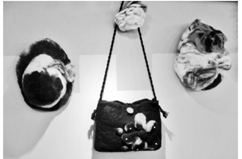
Mulgi kambren tettu vilditüü.

Mulgi kambre tegemiste man om suures toes ollu Christine