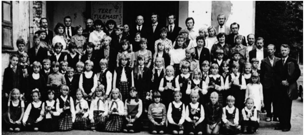
Tõrva muusikakooli vallategemine 1. septembrel 1985. Pildi pääl om kik sii koolipere ja külālise.

R. V.: „Suur asi om sii, et mede kuul ja oma maja om iki alla jāānu. 1993. aastel luudi latsevanembide