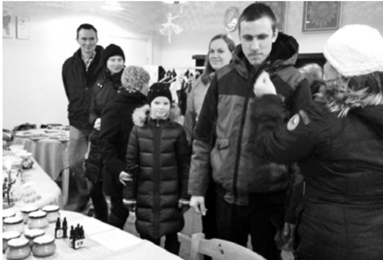
12. detsemberel peeti Ummuli Mulgi kambren laata.

Uvvel aastel lääp tüü edesi ja manu oodetes kah neid, kes enne