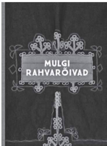
Tõist nõnda suurt ja uhket rahvarõivaraamatut Eestin viil vällä antu ei ole.

Vällä kuulutedi kah Mulgimaa Uhkus 2015. Sedä auida annap Mulgi Kultuuri Instituut vällä 2012. aastest saadik. Siikörd valiti